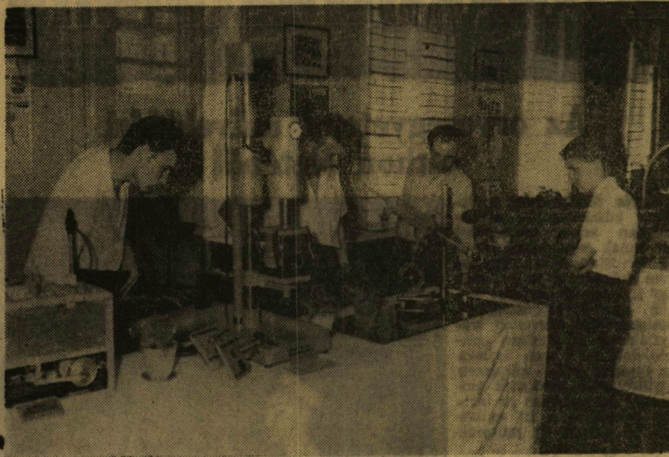
Érdeklődők a Szegedi Orvostudományi Egyetem újítóinak sikeres kiállításán.