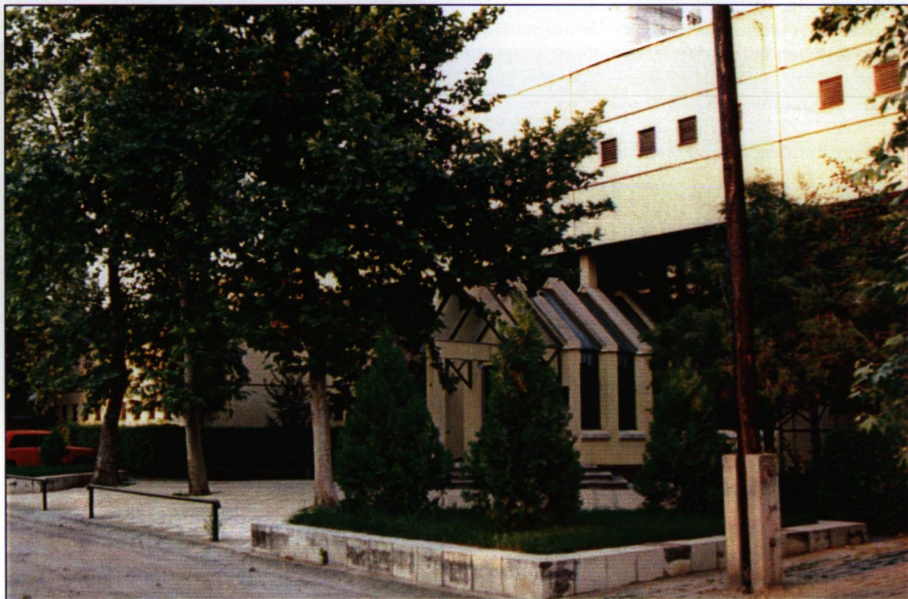
A JGyTF Topolya sori épülete

Napjaink legnagyobb problémáját éppen az, a felgyorsult (technikai-tudományos haladás, civilizáció) változásokhoz való megfelelő alkalmazkodás hiánya, az ember pszichofiziológiai értékeinek csökkenése jelenti. A tudományos „eredmények” és a civilizáció reális ellentmondásokat rejt magában. A tudományos eredmények nyomán jelentősen átalakult az ember és környezete közötti kapcsolat, a gazdasági fejlődés nagymértékben megváltoztatta az ember élet- és munkakörülményeit, csökkentette a