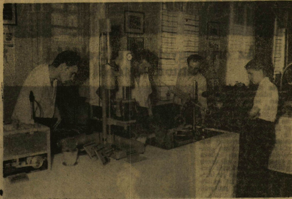
Érdeklődők a Szegedi Orvostudományi Egyetem újítóinak sikeres kiállításán.