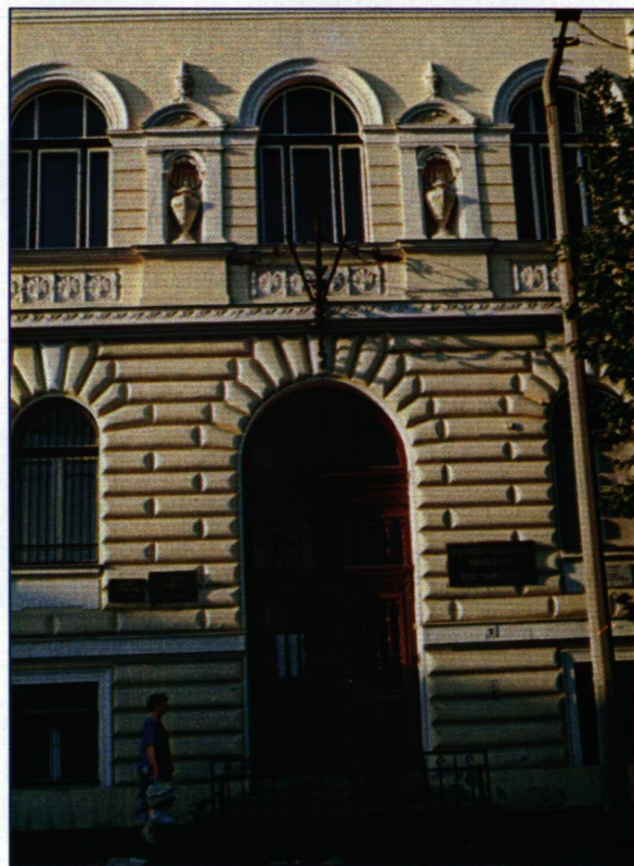
Az Élelmiszeripari Főiskola „A” épülete

Olyan egyetemek, főiskolák integrációjára kerül sor, amelyek önmagukban is versenyképesek az európai felsőoktatás színes palettáján. Hosszú időnek kell azonban eltelnie, hogy a Szegedi Tudományegyetem hírneve elérje, vagy meghaladja a tagintézmények által hozott elismerést. Az integrált egyetem létrehozása önmagában is rendkívül bonyolult logisztikai szervező munkát igényel. Sok függ attól, hogyan közvetítjük Európa felé az új intézményt. Ebben elsősorban a nemzetközi tekintélyt kivívott