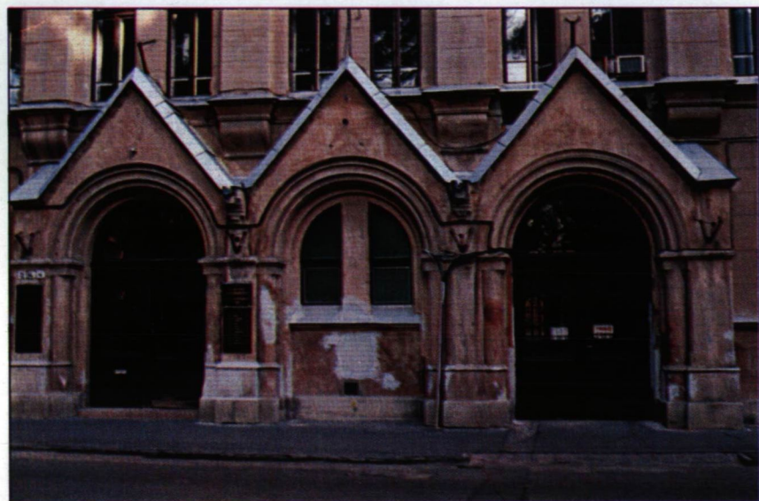
A JATE Bölcsészettudományi Karának épülete

nyert pályázatok száma, értéke, a vendégprofesszori meghívások száma, a hallgatók diákköri sikerei, stb.). ezek alapján a JATE és a SZOTE most is az élmezőnyben helyezkedik el, de nem rossz az a paramétere a tanárképző főiskolának és a konzervatóriumnak sem. Így a Szegedi Tudományegyetem az első négy egyetem egyike, de mindenképpen a legjobb vidéki egyetem lesz már az indulásnál. A Magyar Rektori Konferencia elnökeként alkalmas van mélyebbre látni az európai egyetemi szférába. Biztonsággal állíthatom, hogy a Szegedi Tudományegyetem a felső harmad tagja, sőt egyes tudományágakban még magasabban helyezkedik el. A hallgatói létszám alapján egyetemünk a közepes méretű csoport alsó részében van, de a méret a rangot nem csökkenti.