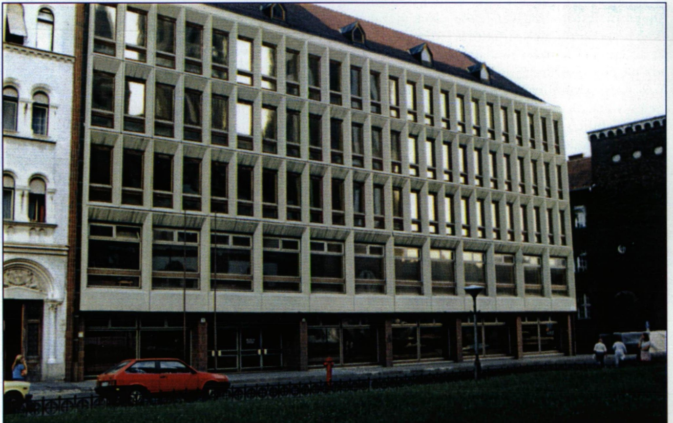
A SZOTE Dóm téri oktatási épülete

A sikeres oktatói-kutatói tevékenység ösztönzése és elismerése is ebbe a feladatkörbe tartozik – mindazon tagok számára – akik a célkitűzések valóra váltásához hozzájárulnak.