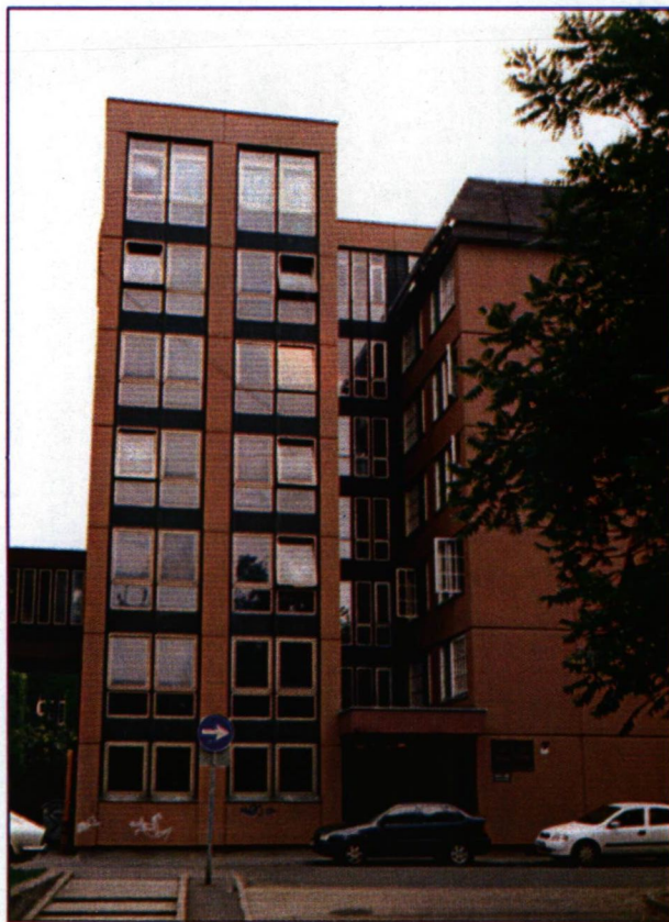
A SZOTE Apáthy Kollégiuma

Nem titkolt elképzelés, hogy Szeged várossal közösen tervezett innovációs és ipari parkok lennének azok, melyek a képzési igényre a javaslatokat megtehetik. Így lehetőségünk adott a termelő oldal irányító munkaerőigényeit kielégíteni azzal együtt, hogy a „management” pénzügyi-jogi személyi feltételeit is