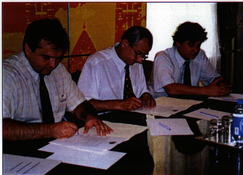
Ösztöndíj-megállapodás aláírása. Szeged város önkormányzata ösztöndíjat alapított a Felsőoktatási Szövetség kiemelkedő tevékenységet folytató hallgatóinak támogatására.

sen egységes új intézményben. A hatékonyabb munka végzéséhez szükséges új beruházásokat a Világbankkal megkötött kölcsön szerződés biztosítja. Ez az út, mint bebizonyosodott, csak Debrecen és Szeged számára volt vonzó, így összesen ezen a két helyen jöttek létre szövetségek. A felsőoktatási törvény ez évi módosítása megváltoztatta a helyzetet, és kijelölte az egyesítendő intézményeket, az egyesítéshez szükséges minden lépést pontosan kijelölt, hogy 2000. január 1-jén új intézmények működhessenek. Ez a bonyolult és nehéz feladat áll minden intézmény előtt, amit úgy kell elvégezni, hogy közben az oktatás, a kutatás, a gyógyítás, a gazdálkodás zökkenőmentesen haladjon. Meggyőződésem, hogy az eddigi előkészítő munkánk, amelynek során az intézmények közötti egyetértés és minél jobb együttműködés vezérelt bennünket, biztosítja a sikeres átmenetet a jelenlegi Szegedi Felsőoktatási Szövetség és a Szegedi Tudományegyetem között.