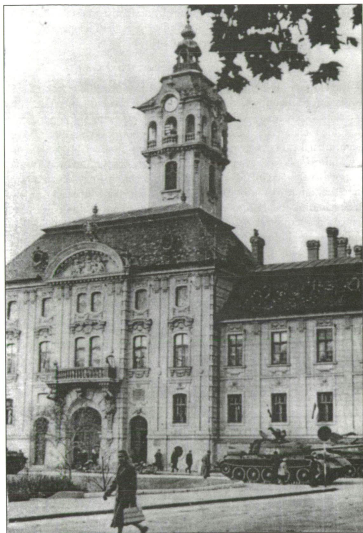
Tankok a szegedi városháza előtt