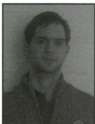
GÁL ANDRÁS NEMZETKÖZI TANULMÁNYOK, II. ÉVFOLYAM

1) Ez ügyben nem vagyok tájékozott, mivel másoddiplomás vagyok, ez az opció lényegében nem érint.