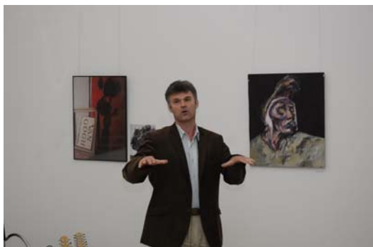
(Fotó: Parafrázisok megnyitó)