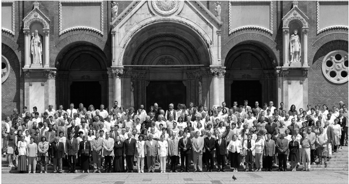
A kar munkatársai 2005

Az SZTE JGYTFK oktatóinak és dolgozóinak közös fotózása során elkészült fényképek