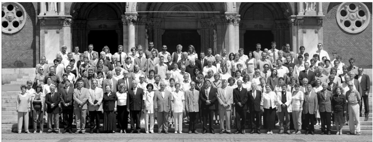
A tanári kar 2005