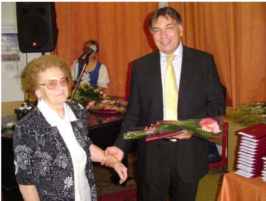
Nyugdíjas pedagógusok köszöntése