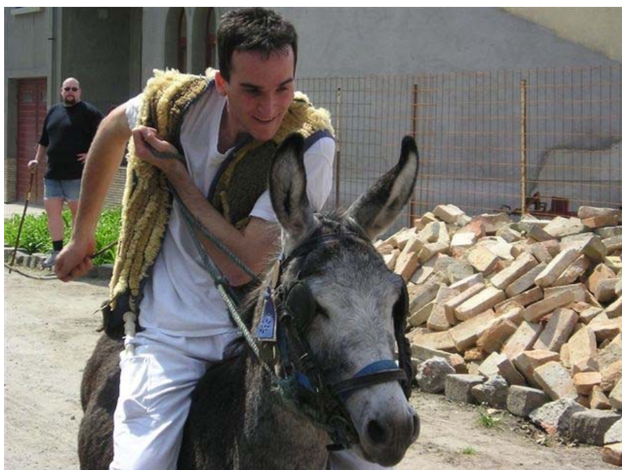
Juhász Gyula Napok