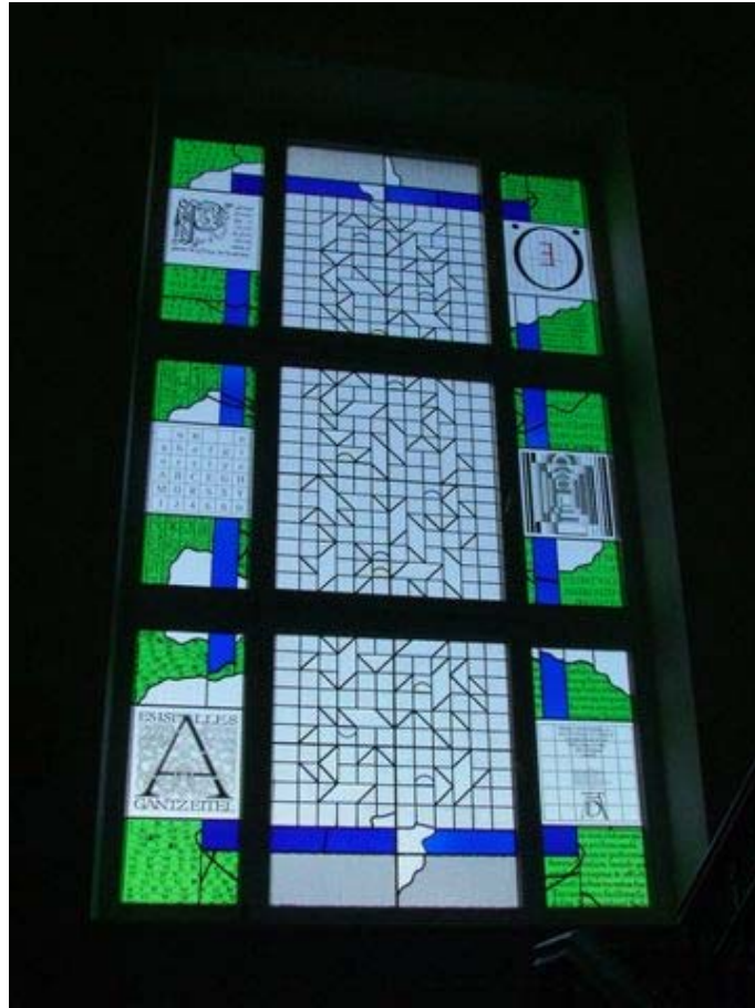
Szilléri díszablak avatása