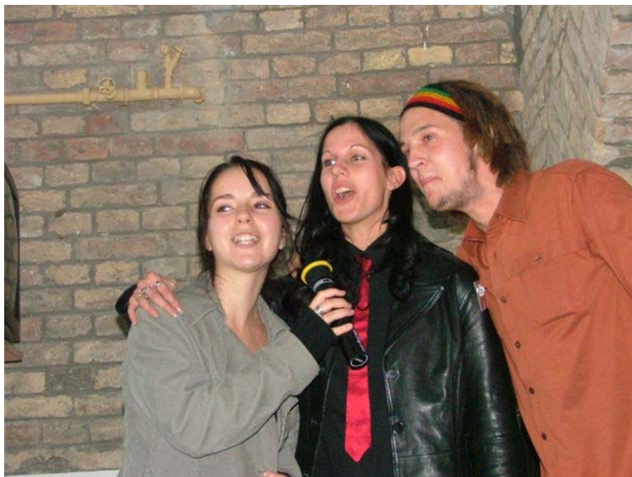
Kultúrzug avató karaoke party