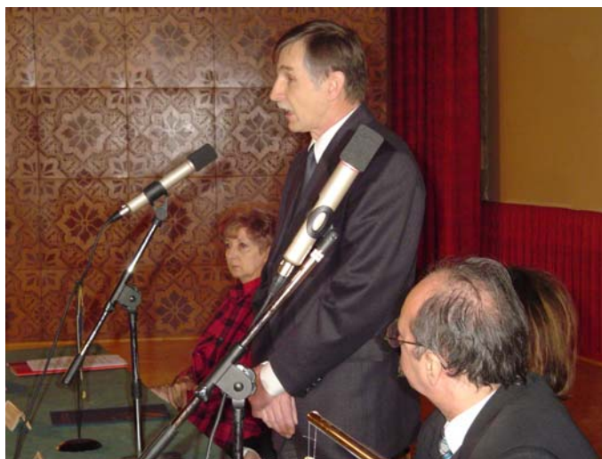
... azt javaslom ...