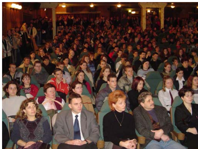
... érdeklődők ...