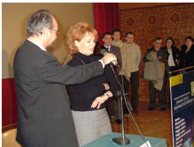
... gyertek velem ...