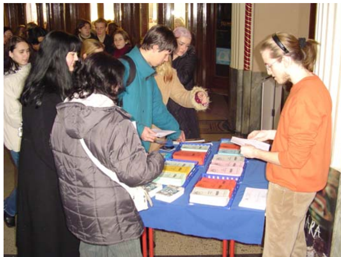
... csak tessék ...