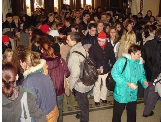
A roham ...

1. számú képmelléklet: Nyílt Nap a JGYTFK-n (2004. január 16-án)