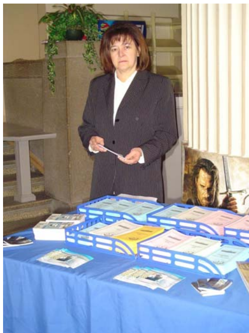
... felkészülten ...