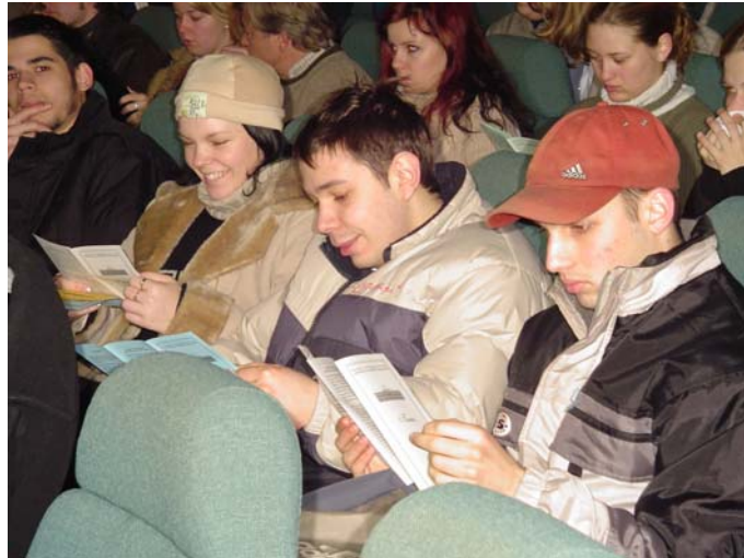
... mit is válasszunk?

2. számú képmelléklet: 2004. február 6-án tartott Összoktatói értekezlet