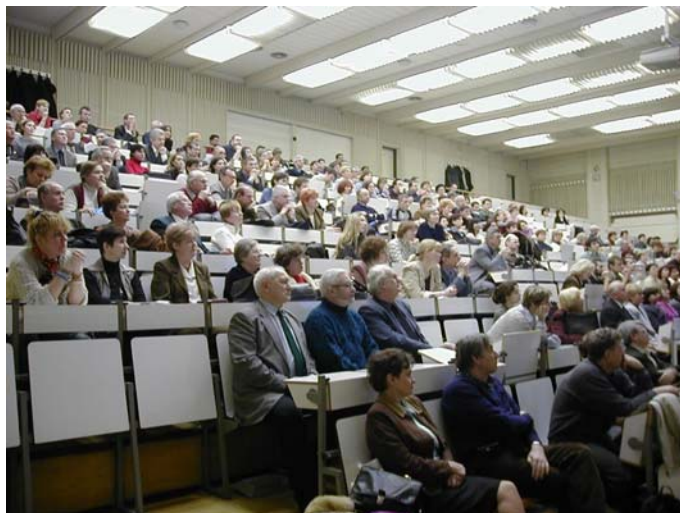
Az SZTE JGYTFK oktatói

2. számú képmelléklet: 2004. február 6-án tartott Összoktatói értekezlet