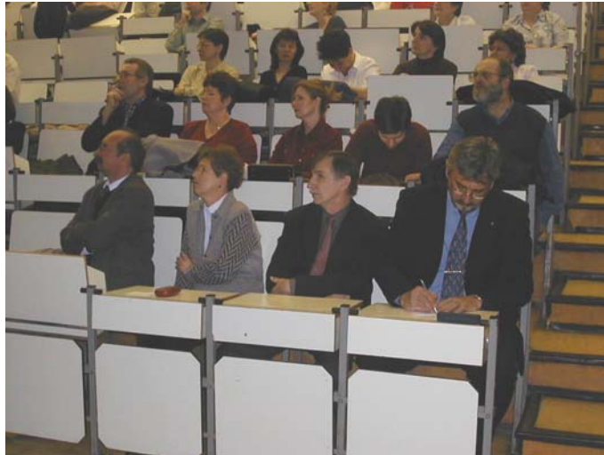
Középvezetők és a rektor