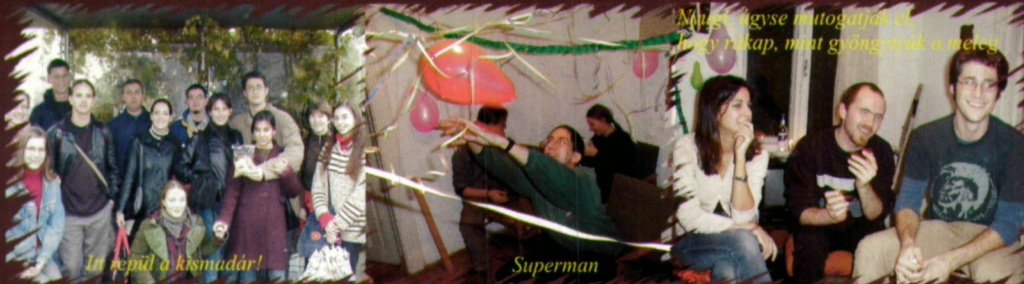
Műs, úgyse mutogatják el, Levegő rakap, mert gyöngyök a méreg