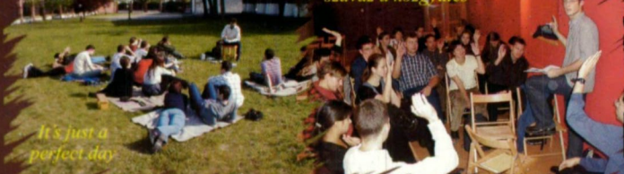
It's just a perfect day