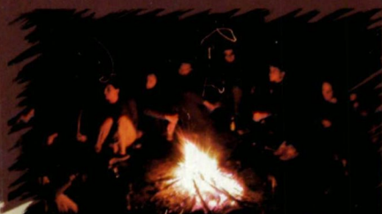
Tűz van, babám!