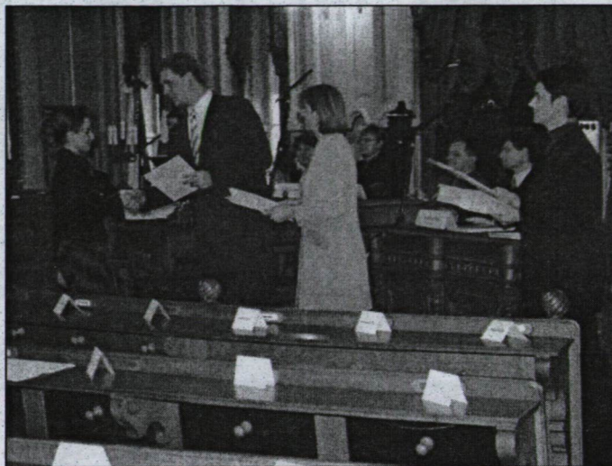
...majd átnyújtja számukra az elismerést.