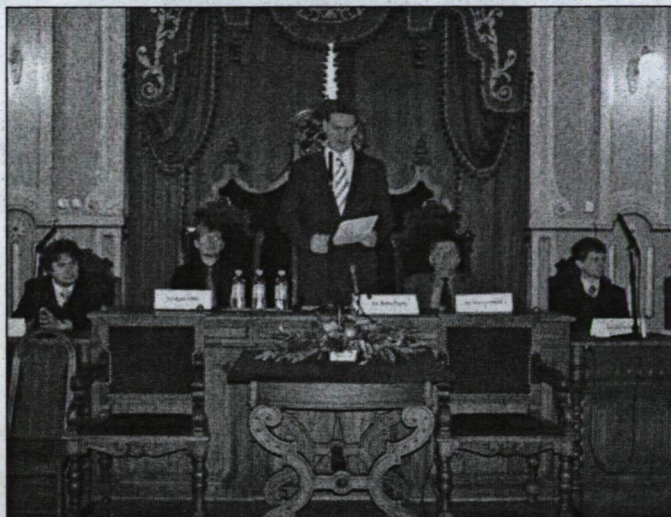
Botka László polgármester köszönti a díjazottakat...