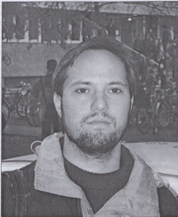
Kollár Árpád tavaly arra kérte a HÖK akkori elnökét, tegye meg a szükséges lépéseket ahhoz, hogy a lap megjelenése jogszerű legyen