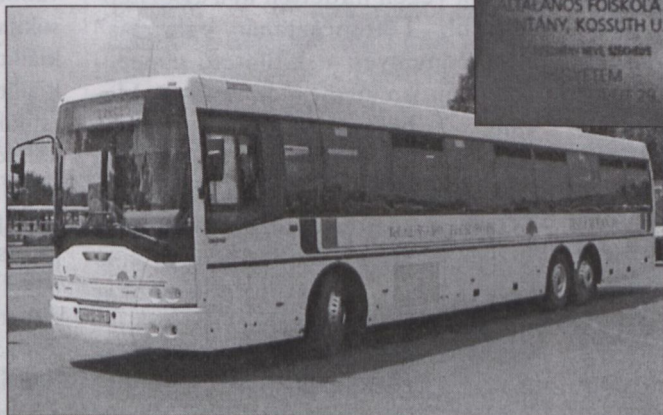
Pénz helyett ezentúl diákigazolvánnyal is válthatunk jegyet