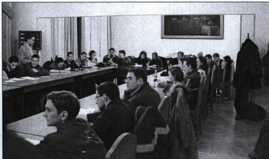
Ülésezik az SZTE EHÖK Választmánya