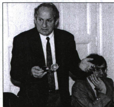
Mészáros Rezső, az SZTE rektora