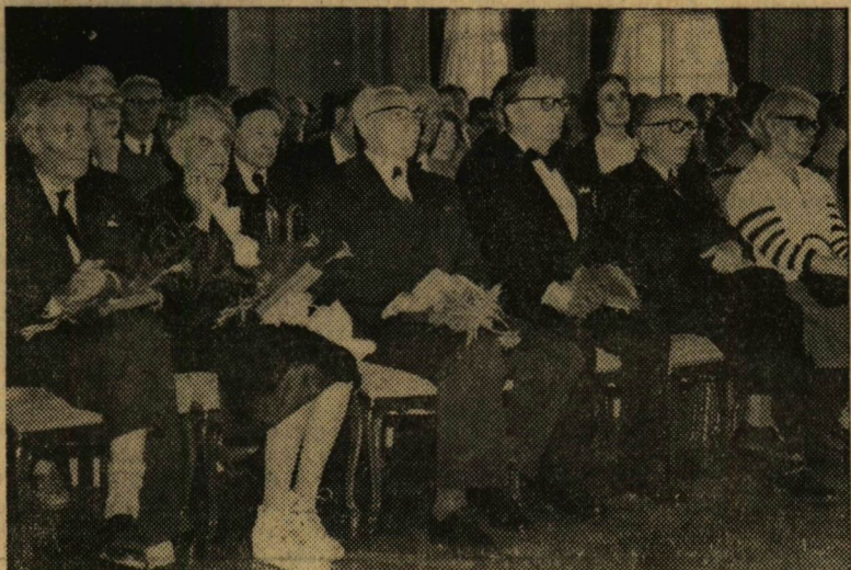
A jubileumok egy csoportja

A felelősségérzet a közösség iránt és az ebből fakadó egyéni kötelezettségek iránt a társadalom egészen és a benne élő egyedeknek legfőbb közös érdeke. Csak ezek mozdíthatják elő olyan közszellem kialakulását, amely idejében észreveszi és határozottan elutasítja a közérdeket sértő önzést, a felelőtlen közömbösséget, a kisajátítási próbálkozásokat, a joggal, a monopóliumhelyzettel való visszaélést, fenntartja az igaz ügybe vetett hit erejét, értékeli az igazságért és méltányosságért való bátor kiállást, segíti a gyengébbet, biztosítja a lelkiismereti szabadságot, a másik ember iránti tapintatot és együttérzést. A szocialista társadalom nem önmagáért, hanem az emberért van és ennél fogva erkölcs is arra kell, hogy irányuljon, hogy az együttélés formáit és az emberek magatartását emberségessé tegye. Abban az élethivatásban, amelyben a mi dolgunk tanítani és nevelni a ránk bízott fiatalokat, ez a szemlélet a világ legtermészetesebb dolga. E tekintetben, ha valaki, mi igazán nem fogadhatunk el kivételeket. De hivatásunk kisugárzásánál fogva nemcsak a magunk szűkebb munkaterületén kell érvényre juttatnunk ezeket az elveket, hanem hivatásunk gyakorlása közben, nap mint nap jó szóval és jó példamondott köszönetet.