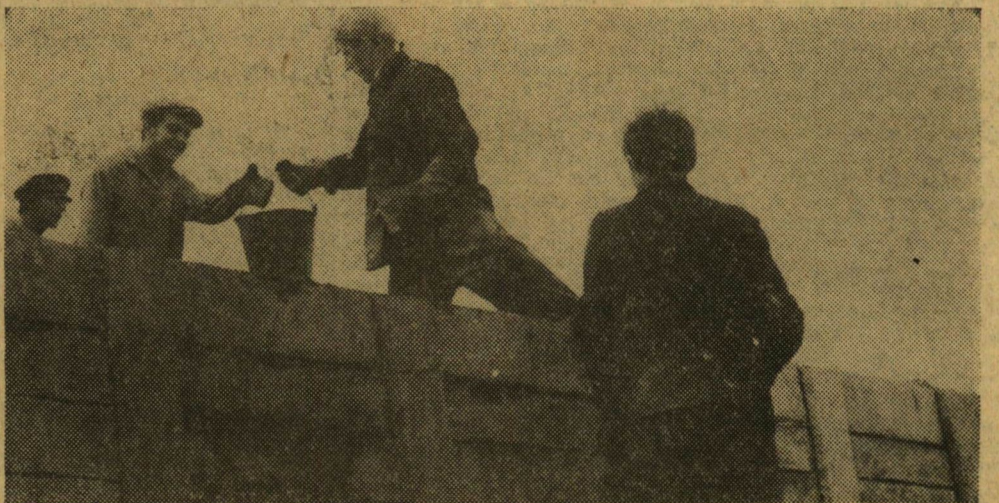
Valahol Kazahsztánban... Kézről-kézre száll a folyékony betonnal teli vödör. A szegedi egyetemisták megállták a helyüket a Frunze szovhozban.