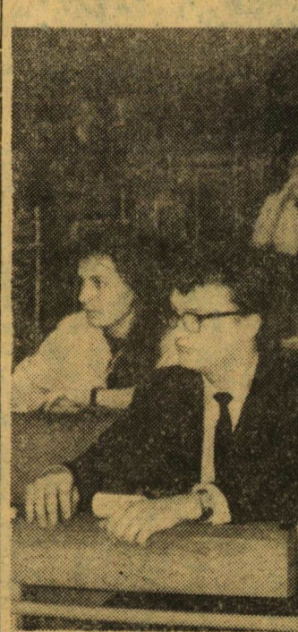
A téli tanfolyam résztvevőinek egy csoportja a Szemeszti klinika előadótermében