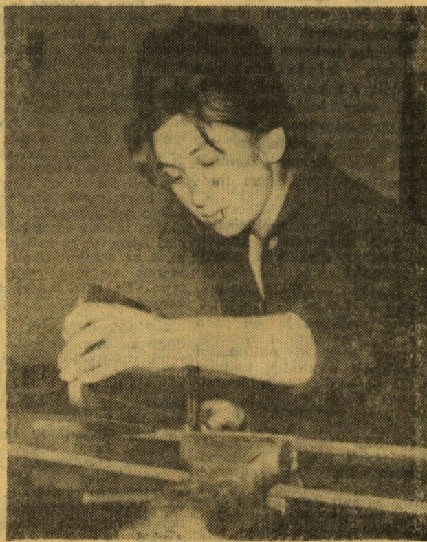
Ez a novi-sadi kislány nem fizeti munkát, hanem — főiskolás, aki a fém-megmunkálás elemi fogásait tanulja, hogy később tovább adhassa a megszerzett tudást.