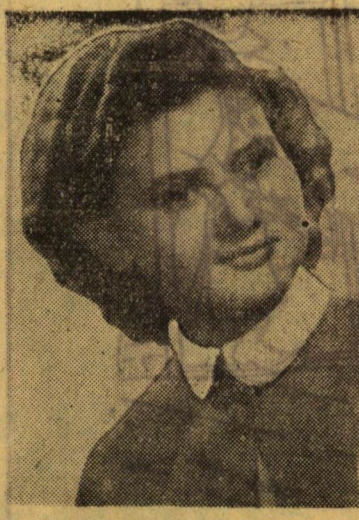
Némédi V. Erzsébet II. éves magyar szakos főiskolai hallgató