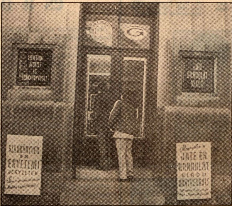
Pillanatkép még a nyitás előtt