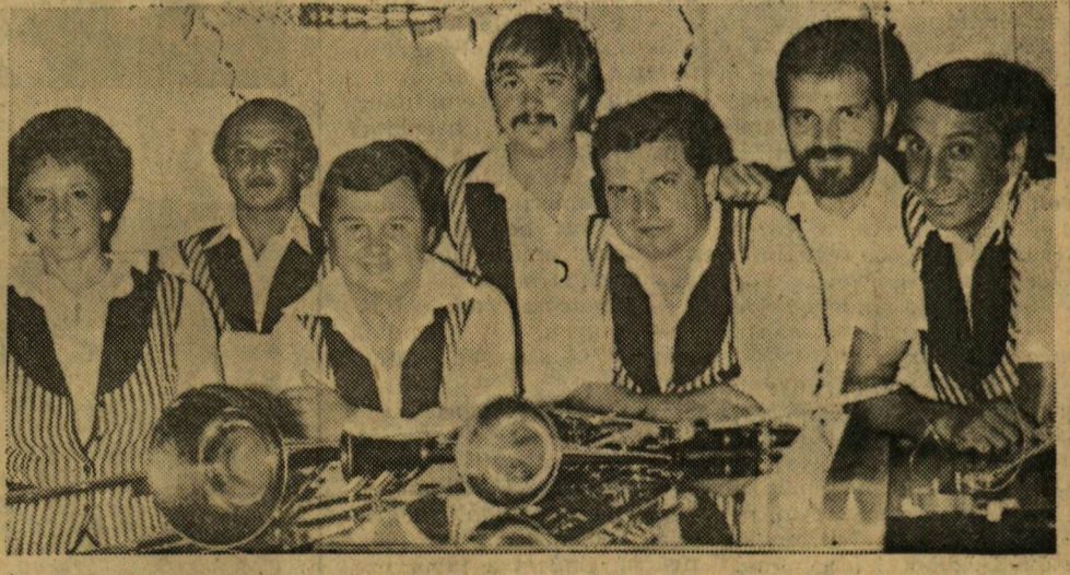
A születésnapot ünneplő együttes — koncert után