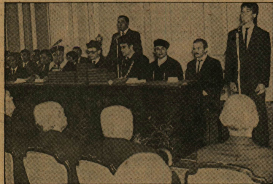
A tudományegyetemi tanévnnyitói elnöksége

Befejezésül a következő szavakkal fordult az elsőévesekhez az intézmény vezetője: „Legtöbbjük kemény szakmai verseny eredményeként foglalhatja el most helyét az egyetemi padokban. Kérem és elvárom, hogy éljenek az önmaguk által kiharcolt lehetőséggel, fejleszték magukat az előttük járó korosztályok segítségével és útmutatásával széleskörű érdeklődésű, alaposan képzett szakemberekké. Ne feleddék el, hogy értelmiségi lenni kettős dolgot jelent: a közösség odaadé szolgálatát és a felismerésközpontú igaságokért való bátor sikerászlást. Mindkettőből vegyék ki részüket már a következő öt évben is. Kíváncsi vagyok, hogy ezek az évek hozzanak sok örömet az Önök számára, kedves szüleik számára, és — az Önök sikerei által — számunkra, oktatóik számára is.”