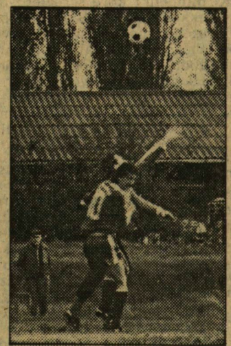
Minden labdáért ilyen harc folyt

Nem csoda hát, hogy a kültekei pályák hangulatát idéző göröngyös, elő nem készített pálya adott „otthon” e várva várt találkozóknak. A sodró kelet-európai szél-