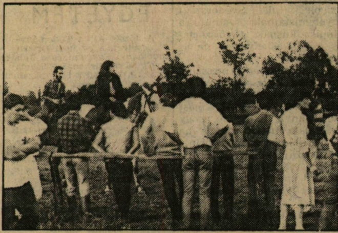
Magas lovon (?)