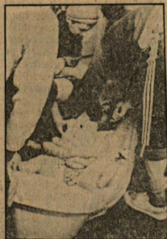
Nagy szakértelemmel darabolták fel a disznót az Apáthy-kollégisták

— A kollégiumi napok hagyomány: megrendezésére hosszú idő óta minden évben sor kerül az orvosegyetemen, nem csupán a szegedin, hanem a másik háromon is. Ahogy visszamelemlésközöm, közülük az 1981-es volt az utolsó, amelyik igazán jól sikerült. Annak szervezői azonban az idők folyamán fokozatosan „kiöregedtek”, s a közben egyetemünkre került új generáció igényeit már nem tudták felmérni. Azóta a kollégiumi vezetőkardákban fokozatos fiatalítás történt, minek következtében — úgy érzem — a kollégiumi munkában emelkedő színvonalat lehet megfigyelni. Régió vajdó probléma hogy a hallgatók nem érzik magukat a SZOTE-klubot, melynek hallgatók általi látogatottsága meglehetősen alacsony. Ezért van szükség különösképpen a kollégiumi közművelődés fejlesztésére, kollégiumi klubok létrehozására. (A régi SZOTE-klub egy ideje tulajdonképpen Apáthy-klubként működik) Gondokat okoz, hogy a kollégiumi bizottságok önállóan kevés pénz fölött rendelkeznek, a rendezvények többségét az egyetem közművelődési bizottságának kerekből lehetséges finanszírozni.