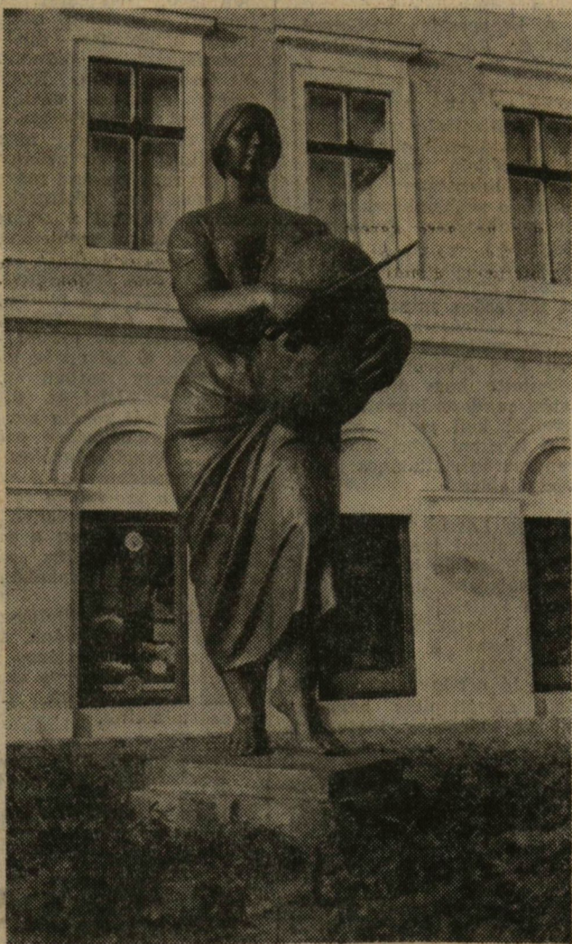
Új köztéri szoborral gyarapodott idén nyáron Szeged. Augusztus 20-án, alkotmányunk ünnepén avatták föl Pátzay Pál szobrát a város egykori kenyérpiaconak helyén, a Klauzál téren.