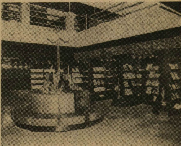
A tágas és izlésesen berendezett folyóiratolvasó