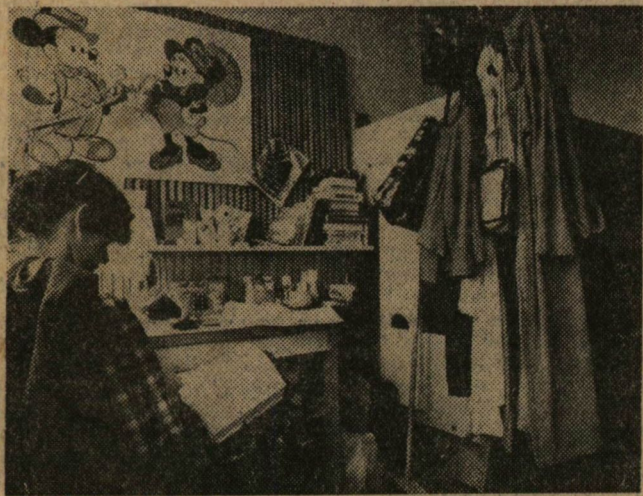
Ezt a szobát már „belakták” tulajdonosai