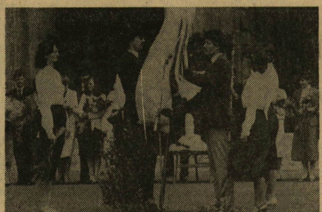
Szegeden elsőként a gyógyszerészek ballagása jelezte a tanév végét. Május 5-én, borongós, szeles időben búcsúztatták a negyedéves, államvizsga-gyakorlatuk előtt álló hallgatókat. A végzős diákok, miután elbúcsúztak a kar intézeteitől, a Dóm téri ünnepségen köszöntek el az intézmény tanáraitól, vezetőitől. Képünkön: a végzősök képviselői átadják a Gyógyszerstudományi Kar zászlaját a harmadéveseknek.