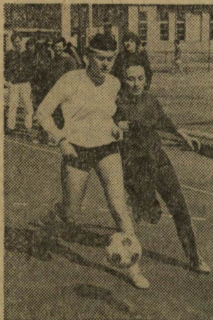
Izgalmas pillanat a női focimeccsen

Hasonló volt a helyzet a sportdelután női foci versenyében, mivel csak két csap-