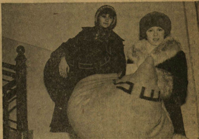
A Hugonnay-ból le...

Mint arról már decemberi lapszámunkban hírt adtunk, elkészült a Szegedi Orvostudományi Egyetem új kollégiuma. Ünneplés átadásra még nem került sor, de a hallgatók már birtokba vehetik a korszerű és esztétikus épületet. Fotósunk a költözködés néhány pillanatát örökítette meg.