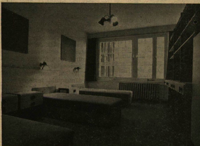
Szobabelső — egyelőre még futó és faliszőnyeg illetve függöny nélkül

A karácsonyi dalestre minden érdeklődőt szeretettel várnak a szervezők.