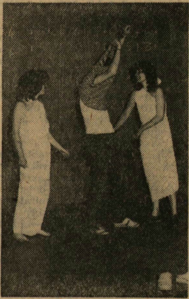
Vetkőzz, édes!

Ha sorjában akarunk haladni a történetekben, akkor először a csütörtök délutáni agytornáról kell szót ejteni. Középes iramban kezdtek a csapatok, látszott: nyugodtak lehetnek, az ötödik hely ugyanis a végzős évfolyam meg nem jelent csapatát illeti.