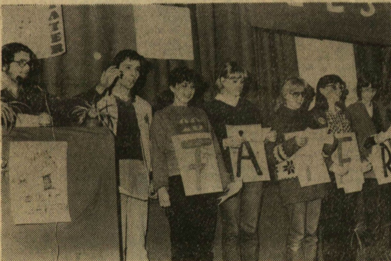
„Eletünket és vérünket” — Faterért