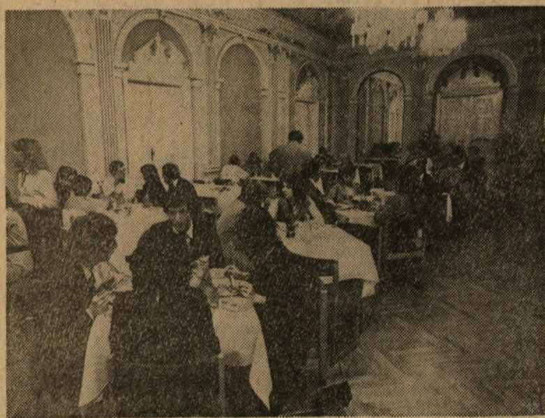
Éttermi pillanatkép