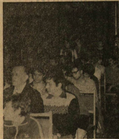
Az érdeklődők egy csoportja