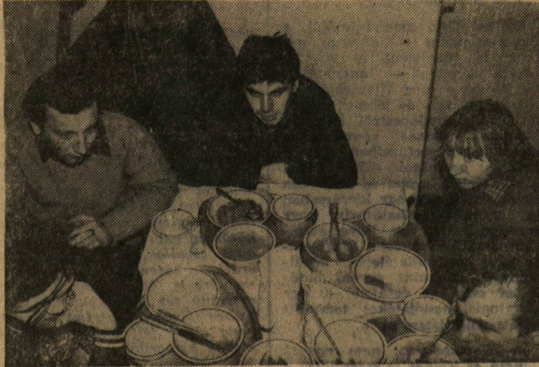
Üresek a tányérok — vajon jól is laktak?