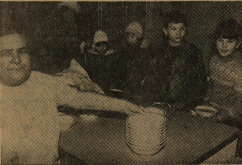
Azok a bizonyos kisiskolások