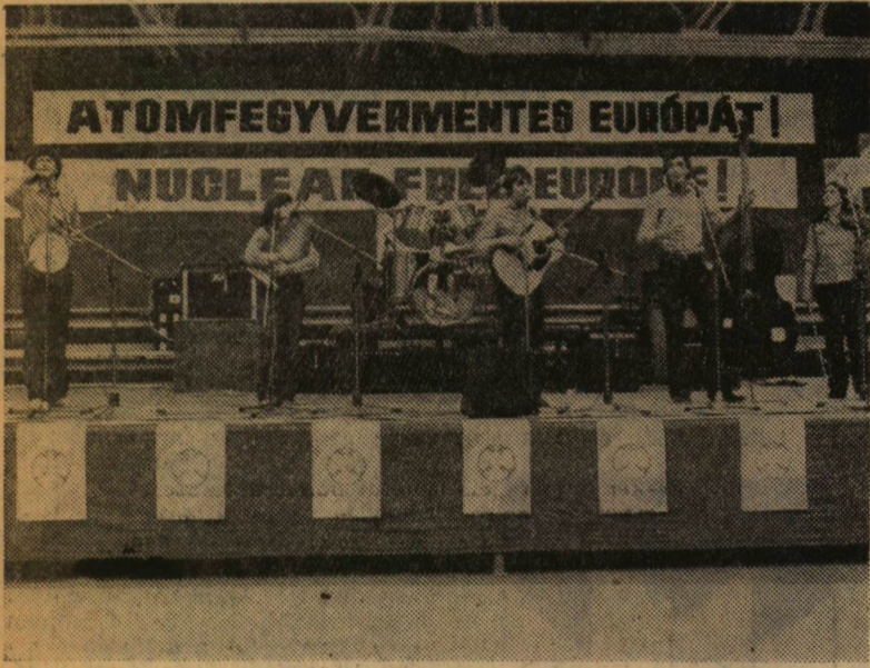
A Bonanza együttes is fellépett a Sportcsarnokban megrendezett ifjúsági békegyűlésen, melyet a JATE által szervezett békekonzferencia keretében rendeztek meg