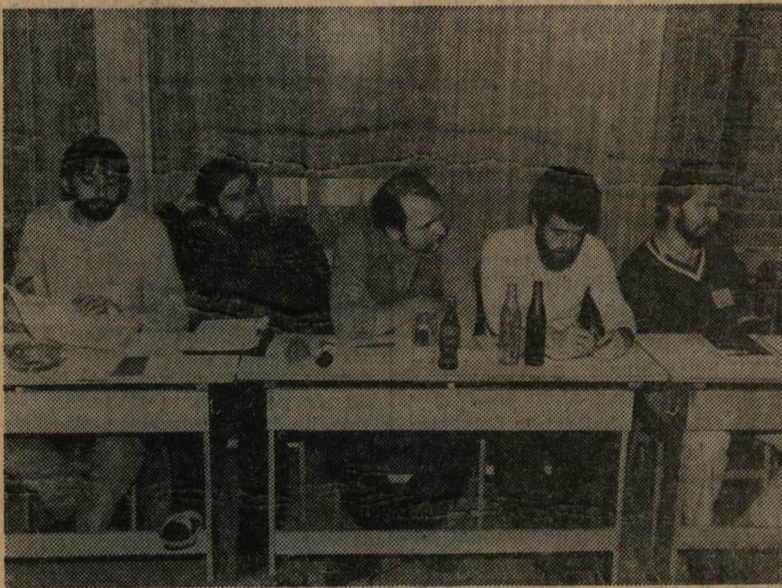
Az előadásokat szekciósülések követték

Beszédének záró részében még arról is szövege az előadó, hogy a fiatalság köreiben nem kis mértékben a nyugati natalmak váltottak ki tiltakozást, azzal hogy szovjet veszélyről beszéltek. Figyelmeztetett: a Szovjetunió mindig válaszfegyverkezés volt, majd így zárta szavait dr. Bulla Miklós: „Az szeretnénk, ha fegyverkezési ellenőrző, csökkentő, le-