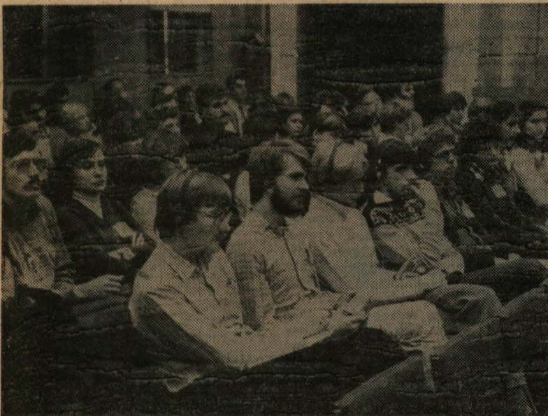
A megnyitó ülés résztvevőinek egy csoportja

nus Tudományegyetem küldte el képviselőjét, a két helyi intézmény — JATE, SZOTE — delegált egyetemistáin kívül. Ugyanakkor megtisztelte a konferenciát jelenlétével a Demokratikus Ifjúsági Világszövetség, a Nemzetközi Diákszövetség, az Országos Béke-tanács valamint a KISZ Központi Bizottságának képviselője is.