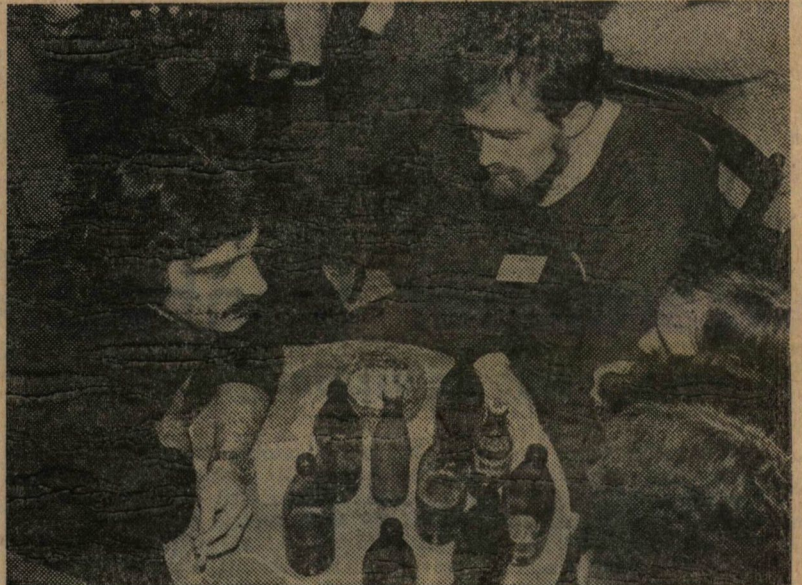
A „bemelegítő” az ismerkedési est volt