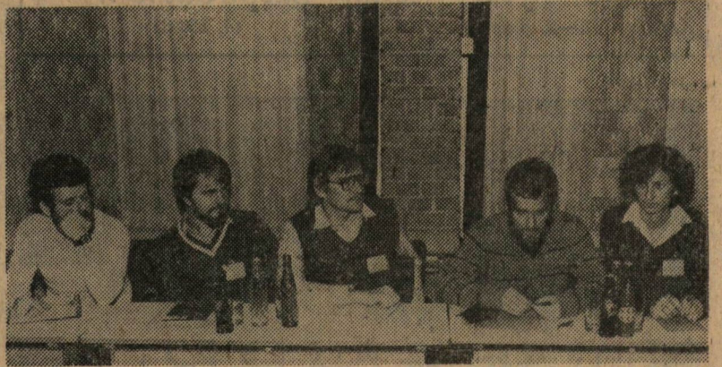
A szekciósülések beszélgetései angol nyelven folytak