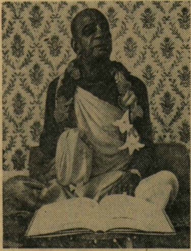
Svami Prabhupada, az alapító indiai bölc

1968-ban West Virginiában létesült egy kísérleti védikus földművelő közösség, New Vrndavana, ahol az indiai Vrndavana szent faluhoz, Krsna szülőhelyéhez hasonlóan kizárólag a Védák tanításai, törvényei szerint élnek. 1972-ben Prabhupada Dallasban megalakította a Gurukula-iskolát, nagy nemzetközi központot hoztak létre Srihama Mayapurban, ugyanitt épül a Védikus Tanulmányok Nemzetközi Intézménye. Jelentősek Prabhupada könyvei is. A vallás terjedésében, terjesztésében a Bhaktivedanta Könyv Tröszt eddig több mint 15 millió