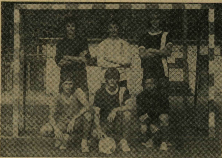
A győztes TTK-s csapat tagjai

Végre hát, befejeződött... Bizony, alaposan elhúzódtak a „Szegedi Egyetem Kupa” kispályás foci-torna küzdelmei, míg végülis szeptember 30-án, délután 3 órakor Balogh Tamás szavára kezdetét vette a befejező összecsapás a TTK és az Alsóvárosi Büfé Klub csapatai között. A döntő első félideje egyenlő erő küzdelmet hozta, kevés focival. Mindkét csapat óvatossá, biztonságos játékra törekedett támadójátékuk pedig többnyire esetleges és eredménytelen akciókban merült ki. Szünet után a természetudományi bar csapata rögtön vezetést szerzett, majd — néhány gyors akcióval szétzilálva a főiskolások védelmét — további két góllal növelte előnyét. Ekkor már az ABC is vezetett jónéhány gólvesztéses támadást, a kapuba találniuk azonban csupán egyetlen alkalommal sikerült. Bár a főiskolások csapatnak is — főként a második félidőben — számos gólhelyzete adódott, a TTK csapata meggyőzőbb mezőnyjátékával s kapu