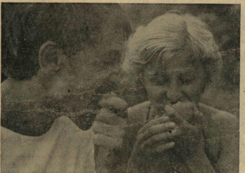
Úgy tűnik a barack iránti guszthus megmaradt!