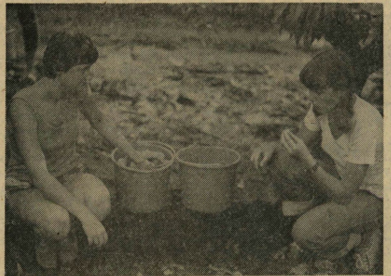
MEO — vagy munkaszünet?