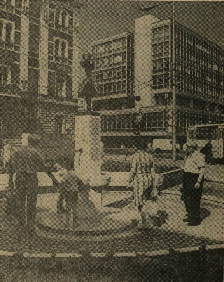
Nyár közepén avatták Szegeden az újjáépített Anna-kutatót és az azt körülvevő pihenőpadokat, virágtartókat. Az építkezés Stifán Sándor tervei alapján folyt. A kúton látható szobor Csáki József alkotása, melyet 1959-ben ajándékozott a városnak, s a legutóbbi időkig a Klauzál téren állt.