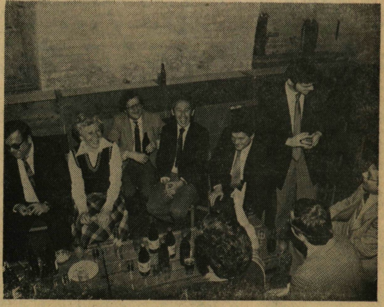
Néhányan az egykori KISZ-vezetők és aktivisták közül