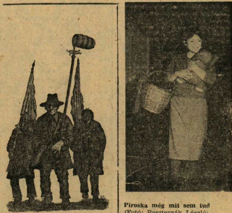
Piroska még mit sem tud