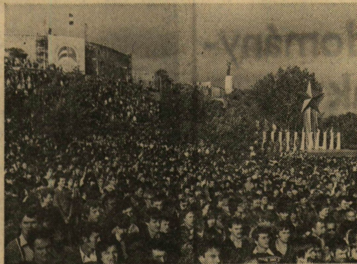
A megnyitó több tízezer tömege a Gellérthegyén