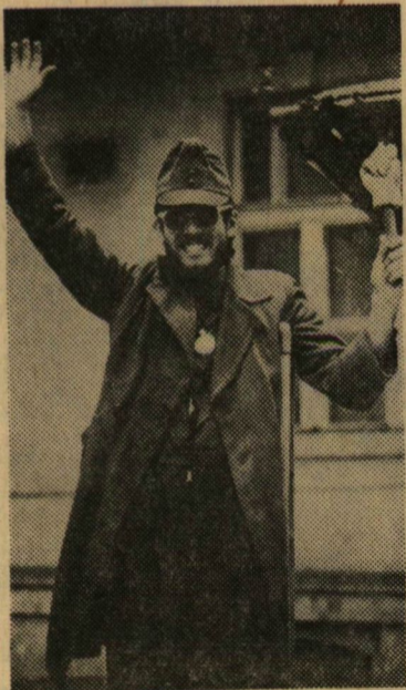
A Béli én lettem! Csak rám kell nézni, nem?