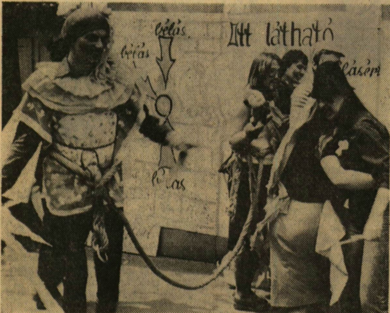
Az „Ótómata-t a Stúdió-színpadosok is kipróbálták. Csak egy „bélás-ba” került...

Most kellene összegezni, értékelni a Bélás-bulit. Mindenesetre a szervezőket (főleg népművelés és rajzszakos hallgatókat) dicséret illeti, egy egész napos „buli” szervezéséért. A főiskola hallga-