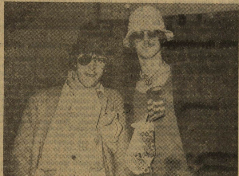
A rongyosbál két punk (?) résztvevője