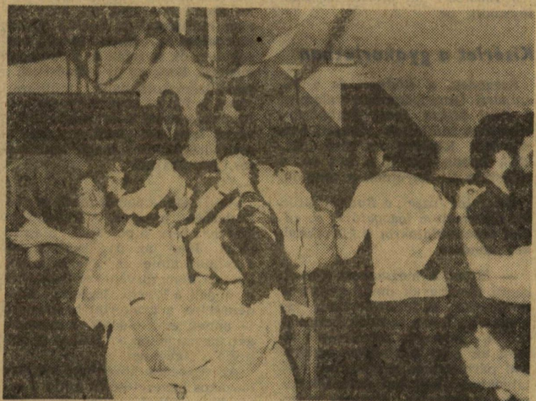
A nagyszerű táncverseny egyik párosa