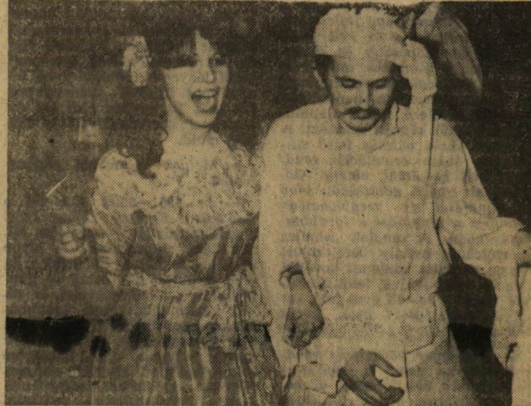
Nem tudni pontosan kik ők, talán Leila, az arab démon és egyik hódolója?

A három nap alatt másutt is hallhattunk a tanyáról, 12-én diaképekkel kiegészített előadást