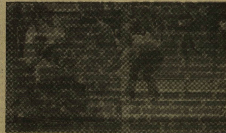
Egy pillanat a labdaváltó játékból